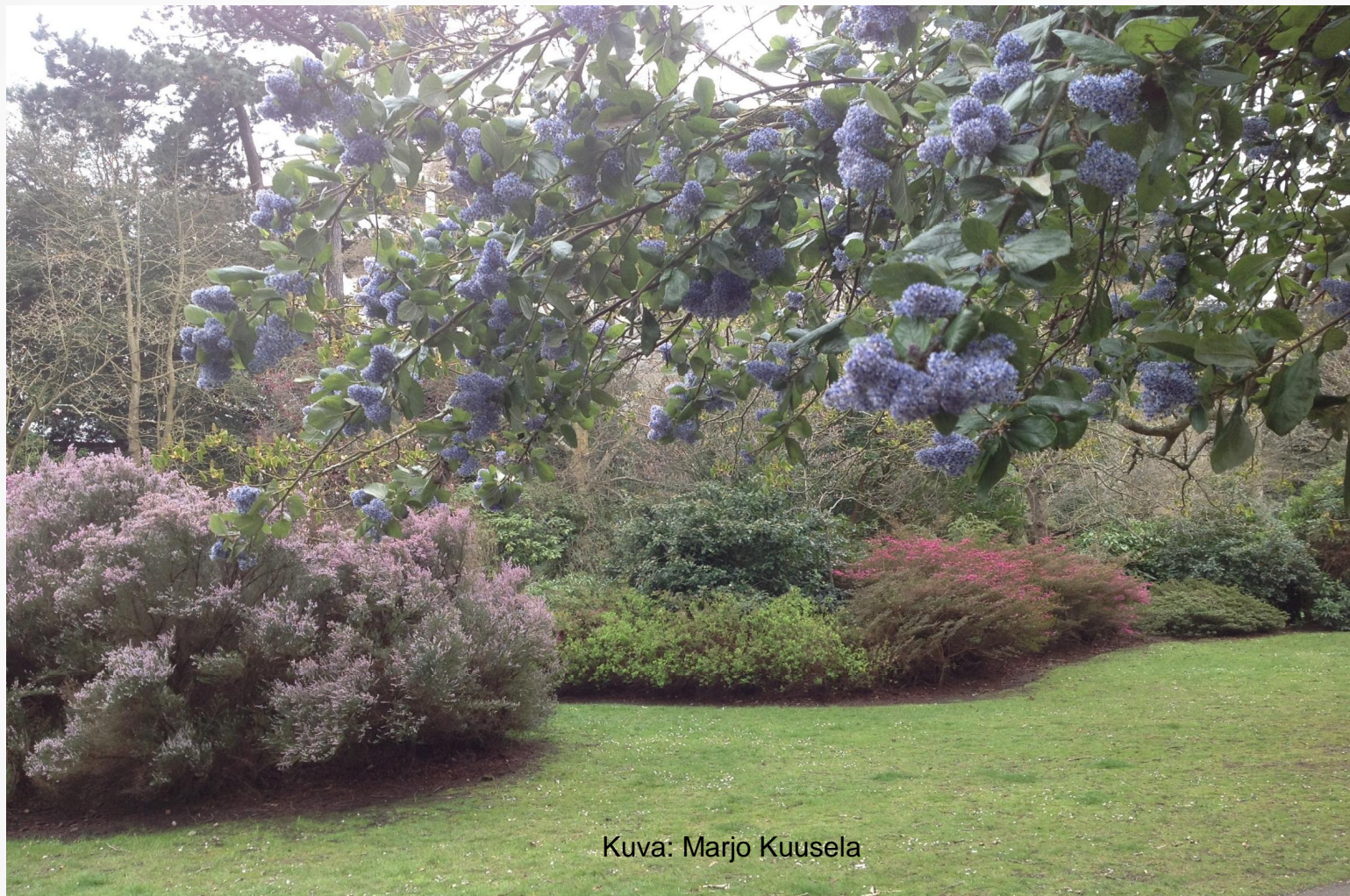
Kuva: Marjo Kuusela