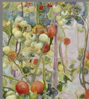
Pekka Halonen: Tomaatteja (1913). Ateneumin taidemuseo