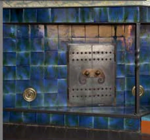
Kansallisromanttinen Hvitträsk (rakennettu 1901–1903)