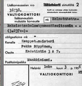
Valtiokonttorin korvausasiaintoimiston arkisto